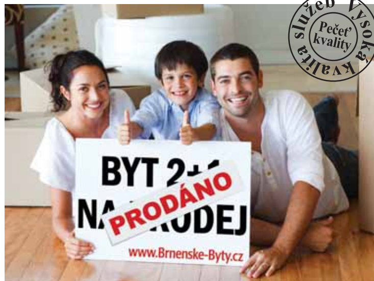
Makléři společnosti e-Finance Reality, prostřednictvím svého webu www.Brnenske-Byty.cz úspěšně realizují realitní zakázky i v době krize.

Klienti e-Finance Reality mají hned několik výhod při realizaci prodeje, pronájmu nebo výměny bytu.