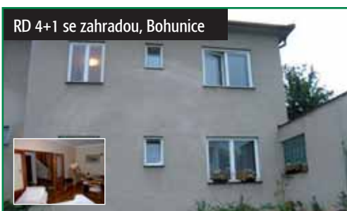
RD 4+1 se zahradou, Bohunice

Brno - město, Bohunice. Samostatně stojící dvougenerační RD 4+1 s garáží a zahradou. Plocha pozemku 376 m 2 , zahrada 114 m 2 , příj. cesta 85 m 2 , předzahrádka 65 m 2 . Veškeré IS. Klidná lokalita. 5 900 000 Kč tel.: 725 640 083