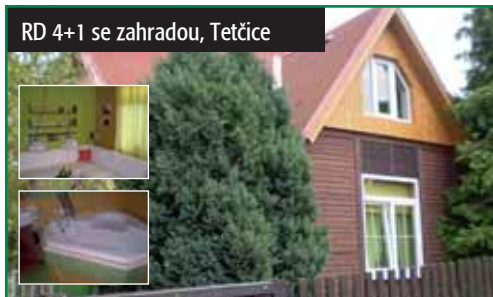
RD 4+1 se zahradou, Tetčice

Okr. Brno - venkov, Tetčice. Prodej RD 4+1, zast. pl. 90 m 2 , zahrada 366 m 2 . Zateplená dřevostavba na klidném místě mimo hlavní silnici. IS kompletní mimo plyn (možno napojit), voda plast, el. měď. 2 900 000 Kč tel.: 724 151 452