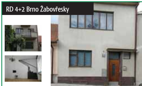
RD 4+2 Brno Žabovřesky

Brno-město RD 4+2 cihlový třípodlažní, celkově podsklepený dům v řad. zástavbě s možností rozšíření půdní vest. Dvě samostatné bytové jednotky. Celk. plocha se zahradou 187 m 2 . Plyn. ústř. topení. 5 500 000 Kč tel.: 602 523 215