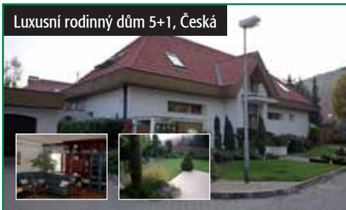
Luxusní rodinný dům 5+1, Česká

Brno - venkov, Česká, prodej luxusního RD 5+1 se zahradou, dvojaráží, vinným sklepem. IS kompletní, na střeše solární panely, v 1. NP podl. topení mimo dětských pokojů, pracovna, 2x koupelna a WC. 10 900 000 Kč tel.: 724 151 452