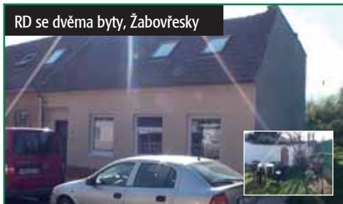
RD se dvěma byty, Žabovřesky

Brno-Žabovřesky. Polořadový cihlový dům technicky rozdělen na dva byty 3,5+1 a 1+1. Celková zastavěná plocha je 143 m 2 . Dům je částečně podsklepen. K domu je pronajatá zahrada 58 m 2 . 4 150 000 Kč tel.: 725 702 548