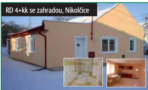
RD 4+kk se zahradou, Nikolčice

Okres Břeclav, Nikolčice. Rodinný dům 4+kk po rekonstrukci s obytnou plochou 92 m 2 , dvorem 158 m 2 a zahradou 86 m 2 . Pokoje 12, 16, 22 a 26 m 2 . Občanská vybavenost. Doprava IDS JMK, 24 km od Brna-Tuřan. 1 770 000 Kč tel.: 602 523 215