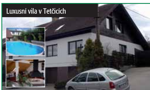
Luxusní vila v Tetčicích

Okr. Brno - venkov, polořadová vila v Tetčicích u Rosic. Zast. plocha 451 m 2 , zahrada 759 m 2 . Dům je cihlový, trojgenerační o 11 pokojích + 3 kuchyně. Posilovna, sauna, 3x koupelna, 2x dvojaráž, bazén. 8 400 000 Kč tel.: 602 523 215