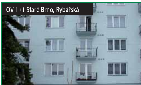
OV 1+1 Staré Brno, Rybářská

Brno, byt 1+1 o ploše 36 m 2 ve 3. podl. cihlového domu na ul. Rybářská. Balkón orientován na JV. Měsíční náklady celkem 2800 Kč. Dům po revitalizaci. V současnosti probíhá kompletní rekonstrukce bytu. 1 550 000 Kč tel.: 724 774 177