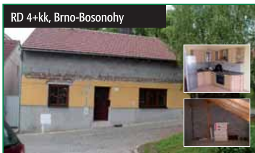
RD 4+kk, Brno-Bosonohy

Brno-Bosonohy, RD 4+kk, přízemí 2+kk již po rekonstrukci ihned k nastěhování, v podkrovní byla zahájena výstavba dvou pokojů a koupelny s WC, veškeré instalace jsou v podkrovní již připraveny. 2 600 000 Kč tel.: 725 702 548