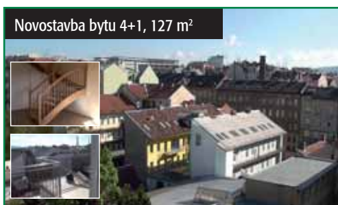
Novostavba bytu 4+1, 127 m 2

Novostavba mezonetového bytu 4+1 127 m 2 v OV, v cihlovém domě na Příkopě s výtahem, v podzemním podlaží je sklepní box. Byt je v 5 a 6 np. Přímo naproti IBC kde je možnost nájmu parkovacího stání. 4 300 000 Kč vč. provize! tel.: 725 702 548